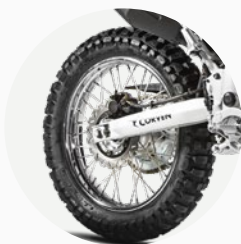
Frenos de disco.

Giros y faro trasero led. Tablero digital completo.